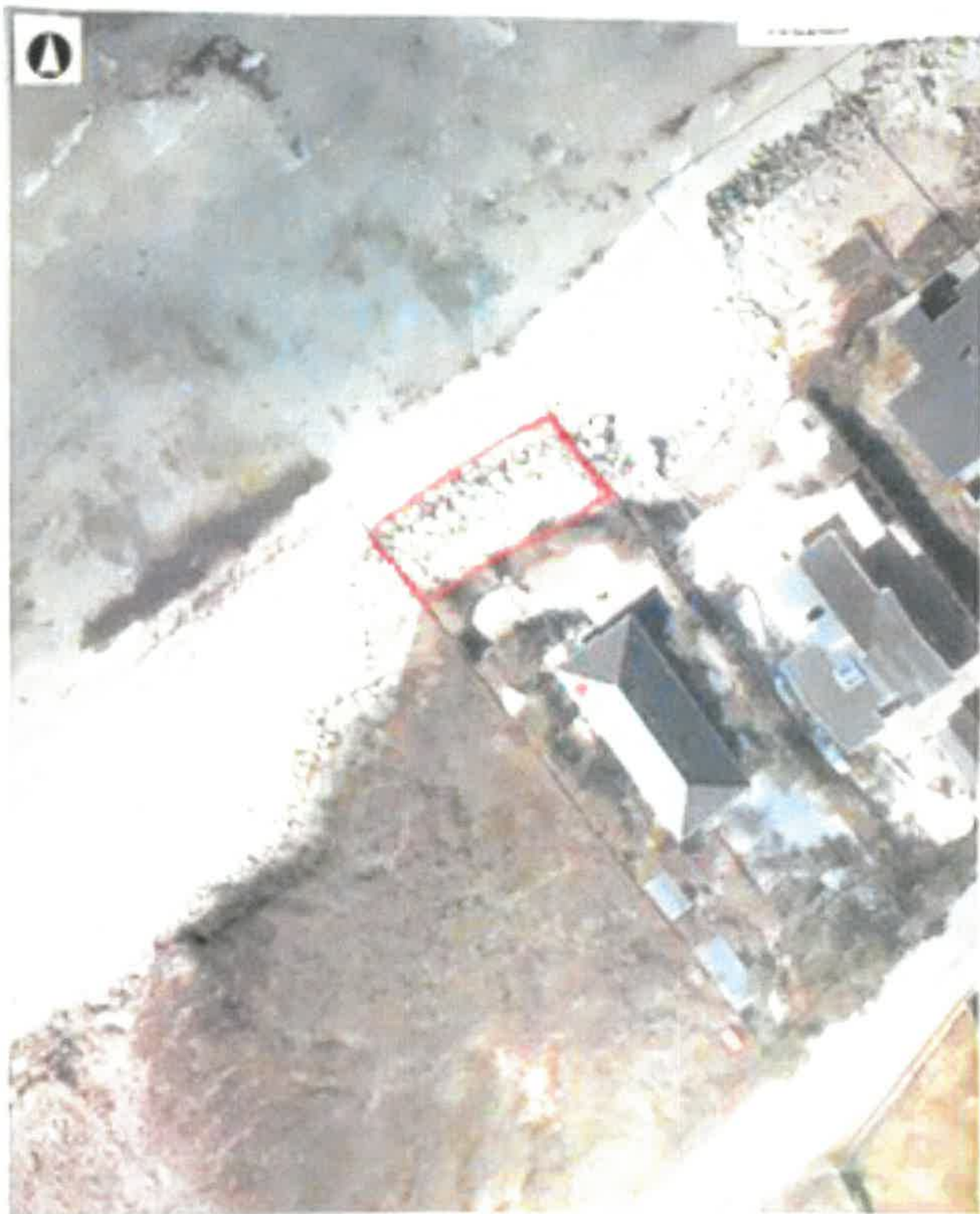
Rind - Afgravnings - 2014 Luftfoto (2013)